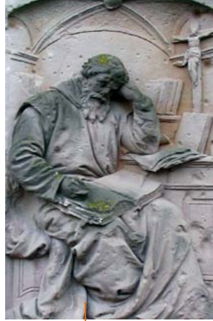
Au IX e siècle Otfried von Weissenburg a écrit le livre des évangiles en dialecte

Ce n'est que vers le XIII e siècle que les écrits en dialecte font leur apparition de manière plus importante dans les administrations, la vie politique, la littérature profane... A partir du XIV e siècle, la langue germanique progresse peu à peu dans la plupart des écrits et finit par concurrencer le latin au XVI e siècle. Les dialectes deviennent des langues officielles de chancelleries, plus particulièrement ceux de la Chancellerie princière de Saxe et de la Chancellerie impériale de Vienne. Un compromis entre les dialectes de ces deux chancelleries s'opère alors pour former, progressivement, un allemand commun. Mais puisque Martin Luther traduit la Bible au XVI e siècle dans son dialecte, qui s'avère justement être celui de Saxe, la langue parlée à la Chancellerie de Saxe influencera davantage cet allemand commun que la langue parlée à Vienne.